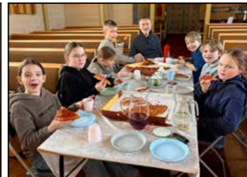
Bibelpizza samling: Måltid i kyrkjerommet i Skjoldastraumen