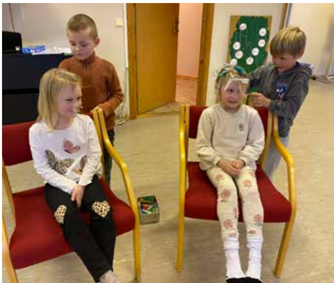
Dåpsskulane i Tysvær og Bokn er i gang. På bildet leiker barna «klesklypeleiken.»