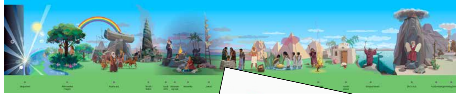
skjerm bilde tidslinjen.no