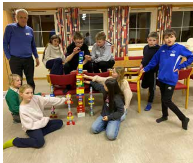
Frå 5.klassetreff i Tysværåg. Her har det blitt bygd tårn ut frå rekkjefølgjen til bøkene i det nye testamentet.