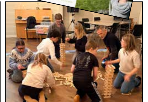
Bibelpizza samling: Tårnkonkurranse i Nedstrand