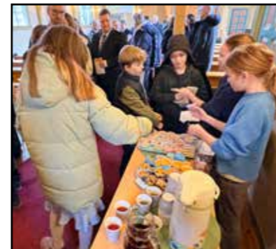
Utdeling av NT på gudstenestene - 5. klassingane las bibeltekstar og hjalp til med kyrkjekaffien i Skjoldastraumen