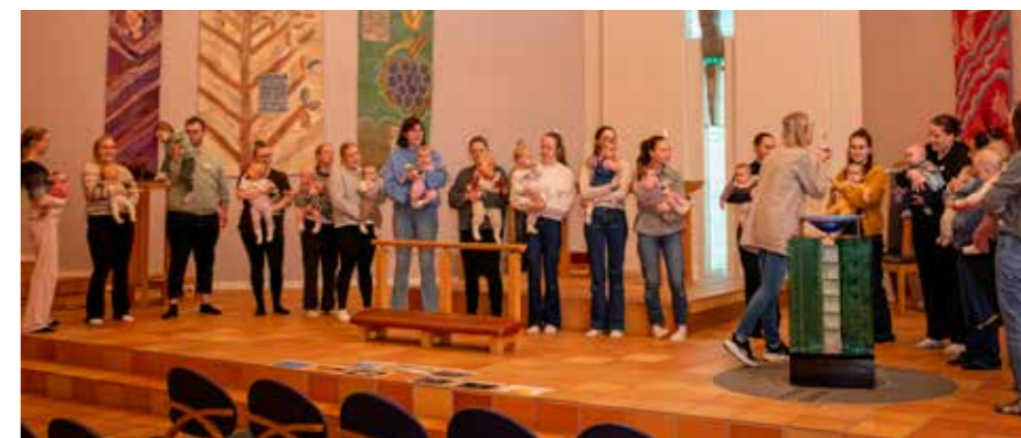
Avslutning i kirkerommet. Se også forsidebildet.